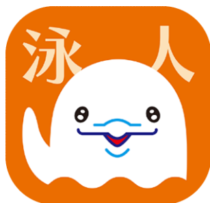
アプリのアイコン